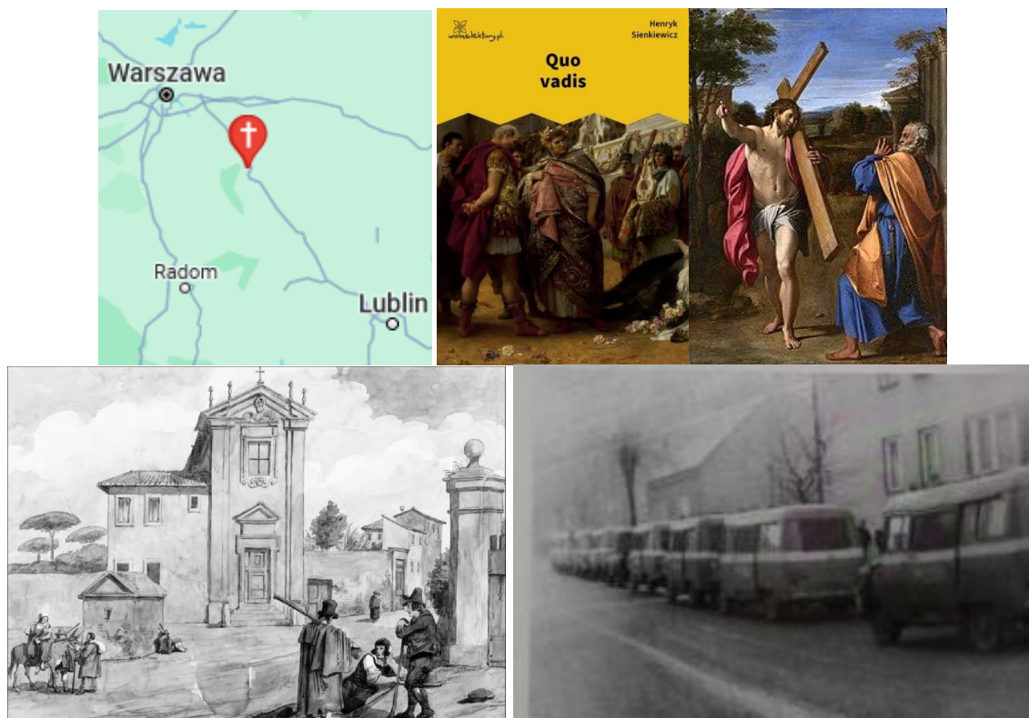
u góry: Domine quo vadis? (1602) Annibale Carracci u dołu: A. Pinelli, via Appia obok kościoła Domine quo vadis (Panie dokąd idziesz)?

Quo vadis na rzymskiej via Appia i garwolińskiej drodze pełnej ZOMO? Po której staniesz stronie?